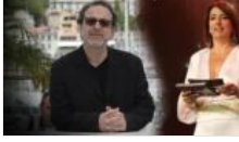
Meltem Cumbul'un tavrına Semih Kaplanoğlu'ndan tepki: