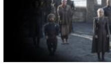
Yeni sezonda Game of Thrones'un kadrosunda değişiklik

Ana Sayfa Kültür-Sanat Caz müziğini tanısanız çok seversiniz!