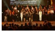
24. Uluslararası Adana Film Festivali'nin büyük ödülleri sahiplerini