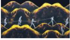
45 yıldan seçkiler 'Hatırla' sergisinde

YAZLAR GÜNDEM SİYASET TÜRKİYE DÜNYA EKONOMİ KÜLTÜR-SANAT ÇİZERLER SPOR YAŞAM TEKNOLOJİ EĞİTİM FOTOĞRAF VIDEO ENGLISH