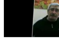
Celal Kılıçdaroğlu itirafçı oldu: Beni...